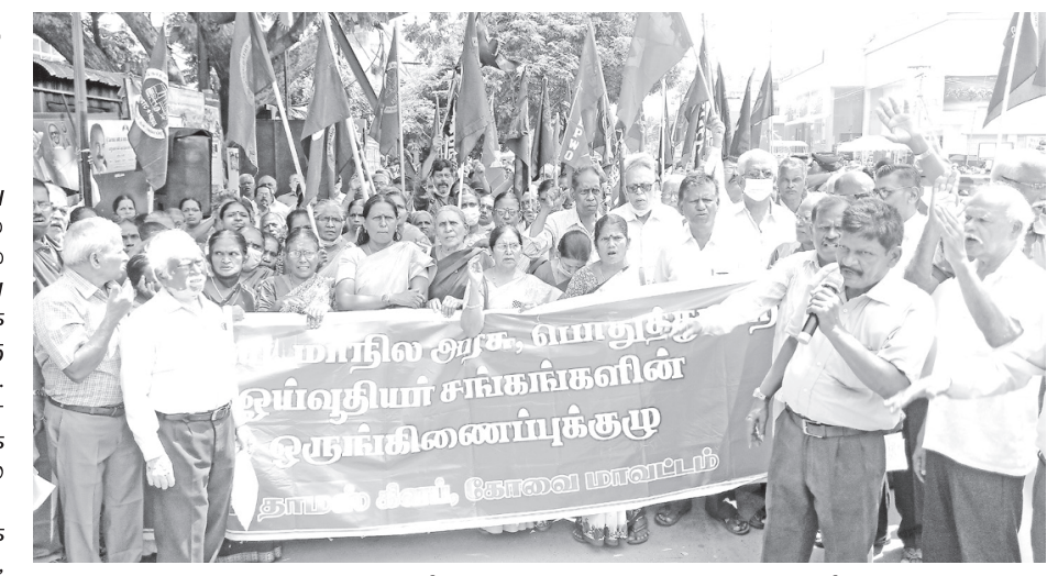
அரசு போக்குவரத்து கழக ஒய்வூதியர்களுக்கு வழங்கப்படாத ஒய்வூதிய உயர்வு மற்றும் அகவிலைபடியை உடனே வழங்க கோரி மத்திய, மாநில பொது துறை ஒய்வூதியர் சங்கங்களின் ஒருங்கிணைப்பு குழுவினர் கோவை மேட்டுப்பாளையம் ரோட்டில் உள்ள மண்டல போக்குவரத்து கழக அலுவலகம் முன் இன்று கண்டன ஆர்ப்பாடடம் செய்தனர்.

இது தொடர்பாக போலீசார் ஏமாற்றுதல், மோசடி உள்ளிட்ட பிரி வுகளின் கீழ் வழக்குப்பதிவு செய்து விசாரணை நடத்தி வருகின்றனர்.